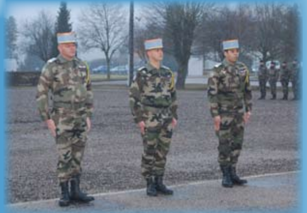
Remise de l'insigne d'honneur au CBA de NAZELLE, au CNE de FRANCE et au CNE M'BODJ le 21 février 2011